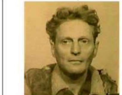
Fotografie a pastorului Richard Wurmbrand în timpul detenției

Misiunea Creștina Richard Wurmbrand este o asociație non-profit, Adresa: Căsuța Poștală 12, OP 74 București, 062580, România. Email: apel@misiuneacrestinarichardwurmbrand.ro ; Pagină Web: misiuneacrestinarichardwurmbrand.ro