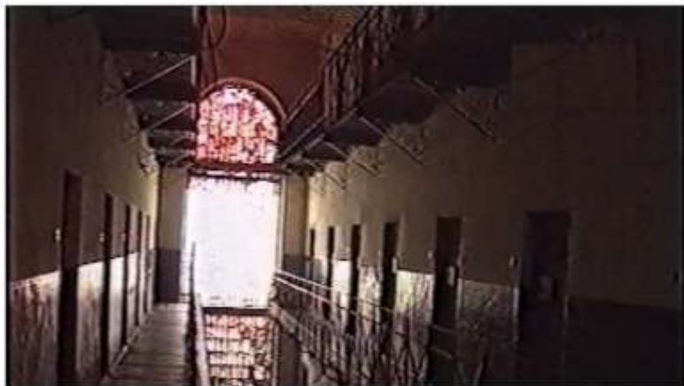
Închisoarea comunistă Aiud, unde preotul Bota (vezi mai jos) a fost închis.

Cheltuielile de funcționare ale orfelinatului, la inaugurarea, în 1993, de către pastorul și doamna Wurmbrand, se ridicau la aproximativ 25.000 de dolari pe an. Datorită numeroaselor cerințe noi ale Uniunii Europene și inflației galopante, orfelinatul are acum nevoie de peste 120.000 de dolari pe an pentru a funcționa corespunzător. Din cauza lipsei de fonduri, orfelinatul trebuie să se bazeze pe donațiile locale de pachete de produse alimentare, cutii, conserve și borcane. Unii dintre copiii mari lucrează la câmp.