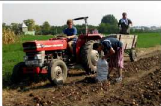
Orfani de la Orfelinatul Agape participând la muncile câmpului.