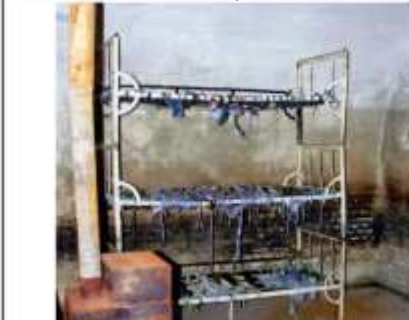
Celulă cu paturi suprapuse, fără saltele, pe care prizonierii erau obligați să doarmă. Soba, doar de decor, niciodată încălzită în nopțile geroase de iarnă