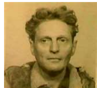
Fotografie a pastorului Richard Wurmbrand în timpul detenției la Jilava