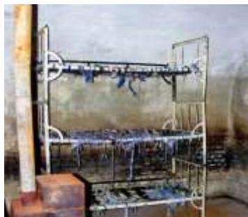
Celulă cu paturi suprapuse, fără saltele, pe care deținuții erau obligați să doarmă. Soba, doar de decor, niciodată încălzită în nopțile geroase de iarnă