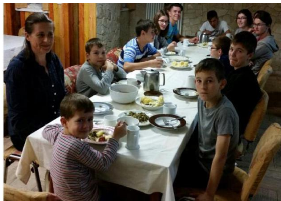
Prânzul la orfelinatul și grădinița Agape