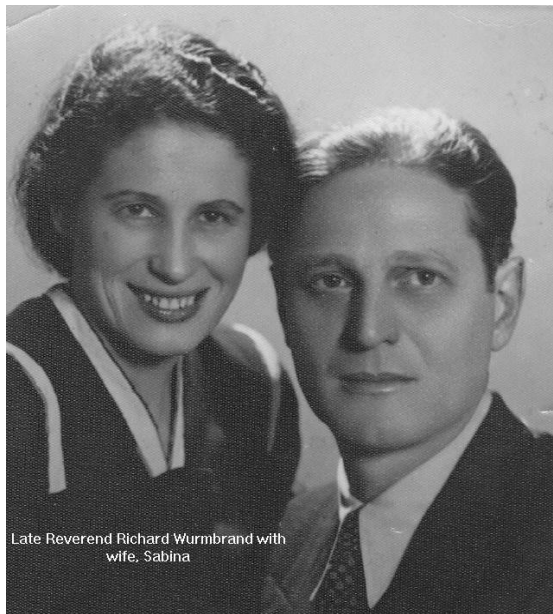
Late Reverend Richard Wurmbrand with wife, Sabina

Asociația Creștină Sabina Wurmbrand Căsuța Poștală 12, OP 74 București, 062580, România Email: apel@asociatiacrestinasabinawurmbrand.ro ; Pagina Web: asociatiacrestinasabinawurmbrand.ro