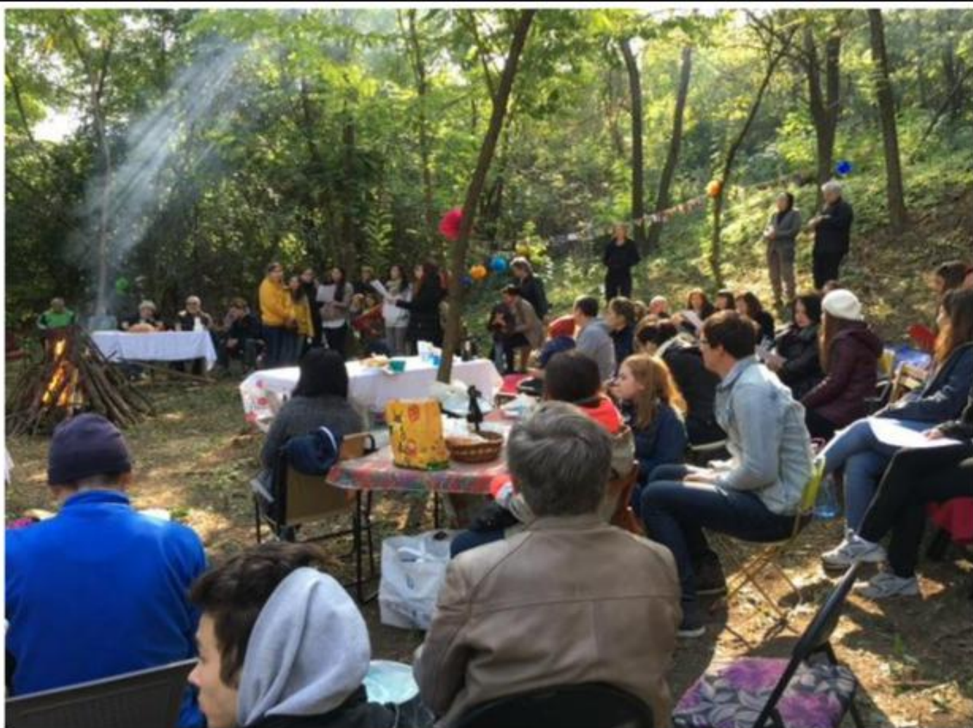
Cântece creștine pentru orfanii de la Agape la o întâlnire în pădure