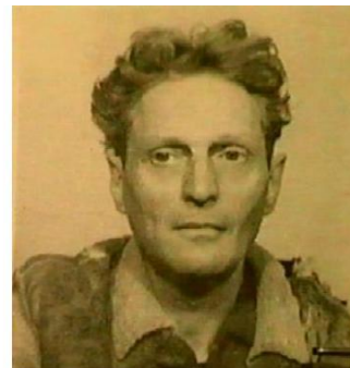
Fotografie a pastorului Richard Wurmbrand în timpul detenției la Jilava.