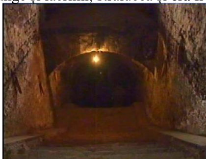
Închisoarea comunistă Jilava. Intrarea spre celulele subterane.

"În timp ce ne gândeam la asta, prima care mi-a vorbit a fost fosta doamnă foarte bogată care acum era săracă și înfometată, cu fața sângerând, mânjită de sânge și lacrimi. Ea a spus, "Acum știu foarte clar, într-adevăr comuniștii îi prigonesc pe creștini, foarte clar că ne-au bătut pentru că am vorbit despre Iisus. Foarte clar este pentru mine că aceasta este cea mai bună dovadă că Dumnezeu vostru este într-adevăr Dumnezeu. Și că Iisus al vostru va fi întotdeauna pentru mine Mântuitorul meu." Dar ea nu știa că în acel moment, fața ei mânjită de sânge și lacrimi, strălucea și era frumoasă precum fața unui înger".