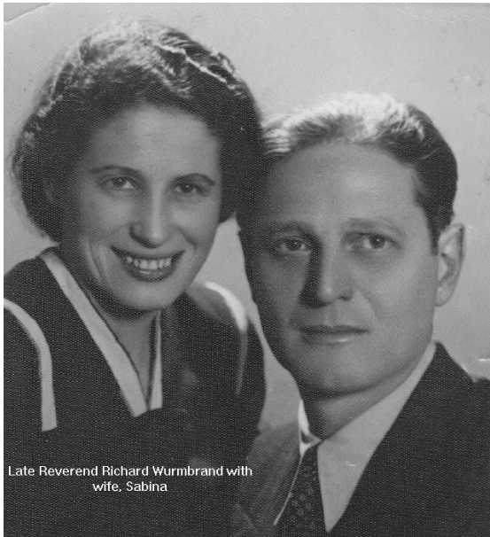
Late Reverend Richard Wurmbrand with wife, Sabina

În aceste momente critice ajutăm refugiați creștini din Ucraina!