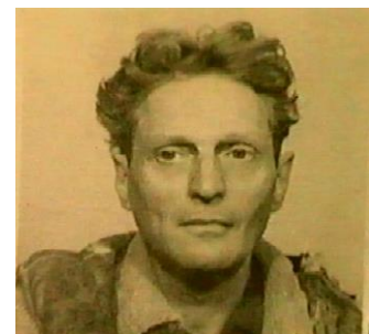
Fotografie a pastorului Richard Wurmbrand în timpul detenției la Jilava