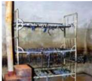
Celulă cu paturi suprapuse, fără saltele, pe care deținuții erau obligați să doarmă. Soba, doar de decor nicidecum încălzită în nopțile geroase de iarnă.