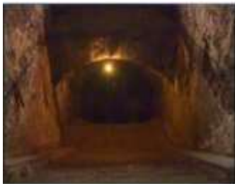
Închisoarea comunistă Jilava. Intrarea spre celulele subterane.

Contemporanii lui Iisus au fost "uimiți de învățătura Sa" (Marcu 1:22). Învățătura Sa era simplă și îți schimbă viața. Căci Iisus le-a spus ucenicilor: " Dacă voiește cineva să vină după Mine, să se lepede de sine, să-și ia crucea și să Mă urmeze." (Matei 16:24). În mijlocul templului, înconjurat de mulțime, El a îndemnat pe unul și pe toți: "Luați jugul Meu asupra voastră și învățați de la Mine " (Matei 11:29). Iisus a spus: " Căci de oricine se va rușina de Mine și de cuvintele Mele, se va rușina și Fiul omului de el, când va veni în slava Sa și a Tatălui și a sfinților îngerii." (Luca 9:26) De-a lungul vremii, adepții lui Iisus au uimit lumea cu dorința lor de a se sacrifica pentru credința creștină. Frații noștri torturați sub dictatura comunistă au putut îndura ura și tortura. Ei nu se rușinează de Cuvântul Său. Viața lor este lucrarea lui Dumnezeu. Susținând dăruirea și sacrificiul lor creștin, aducem slavă lui Dumnezeu.