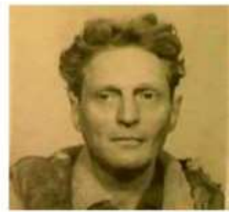
Fotografie a pastorului Richard Wurmbrand în timpul detenției la Jilava