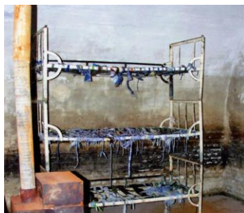
Celulă cu paturi suprapuse, fără saltele, pe care deținuții erau obligați să doarmă. Soba, doar de decor, niciodată încălzită în nopțile geroase de iarnă