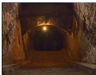
Închisoarea comunistă Jilava. Intrarea spre celulele subterane.

Acesta este marele secret al creștinismului. Din nou, Iisus, când vorbea, nu a folosit niciodată expresia „am”. Niciunul dintre apostoli, primii creștini, nu a folosit vreodată expresia „am”. Creștinii care suferă și se jertfesc pentru Cuvântul lui Dumnezeu sunt sclavii lui Dumnezeu, din dragoste. Persecutorii lor nu pot lua nimic de la ei și nu dețin nimic. Ei sunt doar administratori ai bunurilor lui Dumnezeu. Acești sfinți „CEI CARE NU AU” se bucură chiar și în închisoare și iradiază din bucuria lor către atât de mulți care sunt nefericiți pentru că sunt amăgiți să creadă că au multe.