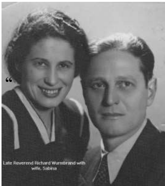
Late Reverend Richard Wurmbrand with wife, Sabina

Misiunea Creștină Richard Wurmbrand (numită anterior Asociația Creștină Sabina Wurmbrand) Căsuța Poștală 12, OP 74 București, 062580, România Email: apel@misiuneacrestinarichardawurmbrand.ro ; Pagina Web: misiuneacrestinarichardawurmbrand.ro