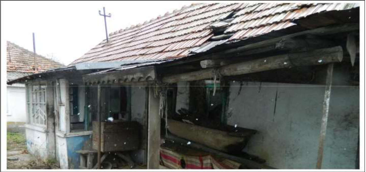
Casa dărpănată din care au fost salvați cele trei fete