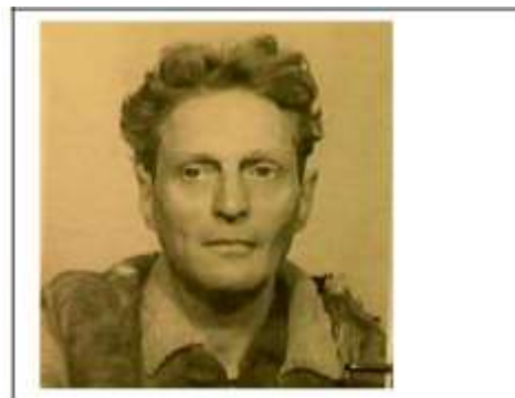
Fotografie a pastorului Richard Wurmbrand pe vremea când era deținut la Jilava