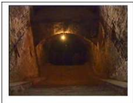
Închisoarea comunistă Jilava Intrarea spre celulele subterane

A deveni una nu înseamnă numai închinare, în acord și cu simțământul "Sunt bine, ești bine". În istoria bisericii, de multe ori a apărut un creștin, cineva considerat nesemnificativ, dar această persoană a făcut diferența prin aprinderea din nou a focului strălucitor pe care Domnului L-a adus pe pământ, a iubirii pentru frații noștri creștini.