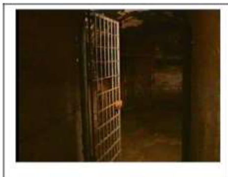
Celulă total întunecată din Jilava unde mulți creștini erau ținuți prizonieri