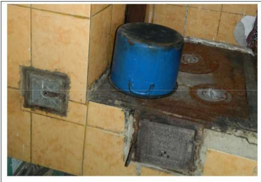
Bucătăria foarte murdară