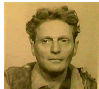
Fotografie a pastorului Richard Wurmbbrand în timpul detenției la Jilava