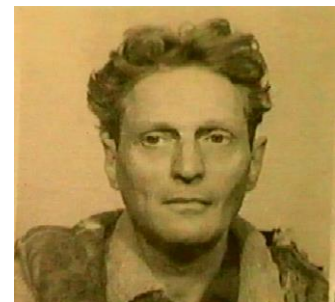
Fotografie a pastorului Richard Wurmbrand în timpul detenției la Jilava