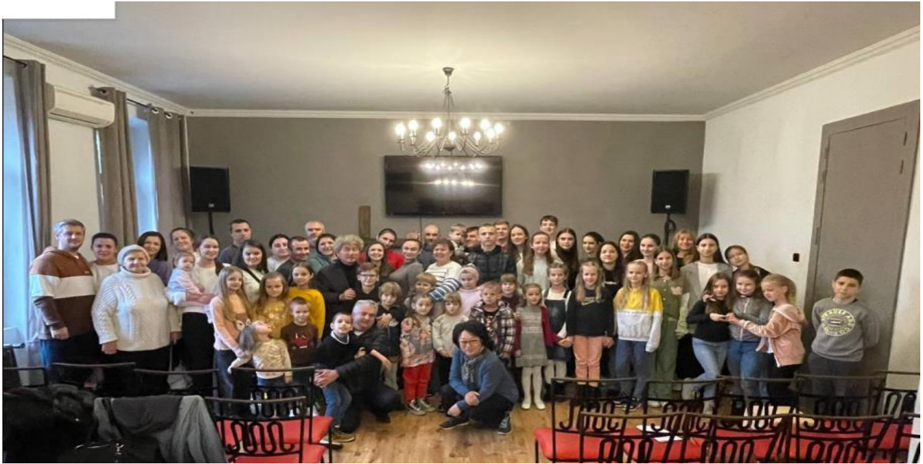
Copii în școala duminicală din biserica refugiaților creștini din Oradea

Sora din Ucraina NEFEDOVA OLESIA VASYLIVNA a scris: