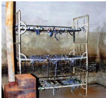
Celulă cu paturi suprapuse, fără saltele, pe care deținuții erau obligați să doarmă. Soba, doar de decor, niciodată încălzită în iernile geroase.