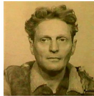
Fotografie a pastorului Richard Wurmbrand în timpul detenției la Jilava