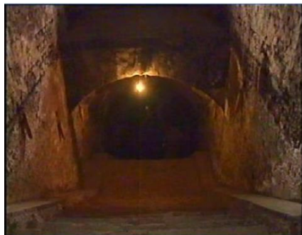
Închisoarea comunistă Jilava. Intrarea spre celulele subterane.