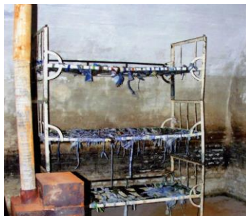
Celulă cu paturi suprapuse, fără saltele, pe care deținuții erau obligați să doarmă. Soba, doar de decor, niciodată încălzită în nopțile geroase de iarnă