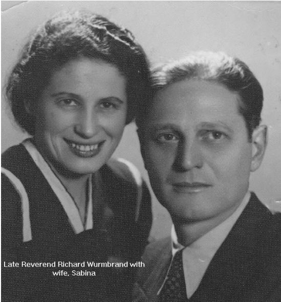
Late Reverend Richard Wurmbrand with wife, Sabina

Ajutăm orfani și creștini în vârstă (mulți cu vârste peste 80, 90 de ani) care au fost închiși pentru credință în actuale și foste țări comuniste. În aceste momente critice ajutăm refugiați creștini din Ucraina!