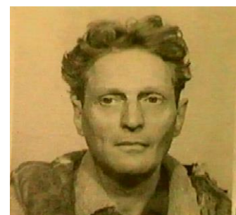
Fotografie a pastorului Richard Wurmbbrand în timpul detenției la Jilava