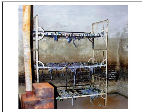
Celulă cu paturi suprapuse, fără saltele, pe care prizonierii erau obligați să doarmă. Sobă doar de decor, niciodată încălzită în nopțile friguroase de iarnă.