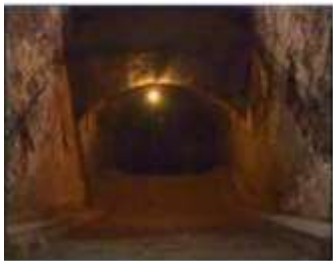
Închisoarea comunistă Jilava. Intrarea spre celulele subterane.

Unii dau totul pentru Hristos, libertatea, onoarea și viața lor. Unii își îndeplinesc datoria și dau zeciuiala bisericii sau răspândesc broșuri creștine. Dumnezeu este modest. Să-I auzim vocea Sa liniștită. El a cerut doar doi-la-o-mie parte din pradă. O zi are 1440 de minute. Dați a doi-la-mie parte sau aproape trei minute de rugăciune, pentru suferința fraților și surorilor dumneavoastră, care au fost persecutați pentru credință. Dumnezeul modest este recunoscător pentru cea mai modestă contribuție.