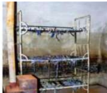
Celulă cu paturi suprapuse, fără saltele, pe care deținuții erau obligați să doarmă. Soba, doar de decor niciodată încălzită în nopțile geroase iarna.